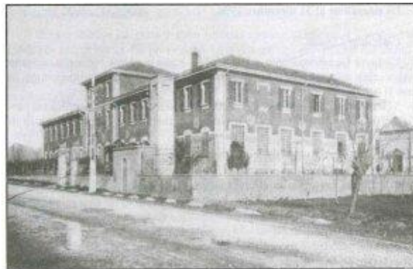
Figura 1: Sede iniziale della Casa di Riposo Molina. Veduta Generale del fabbricato sede del Pensionato Femminile

un'area complessiva di 25.000 m 2 (di cui 15.000 m 2 area verde), con percorsi pedonali e protetti.