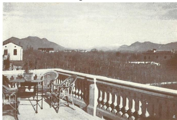
Panorama dal terrazzo superiore

La Legge Regionale 13/02/2003 n. 1, trasformò l'Istituto in una Fondazione privata senza scopo di lucro.